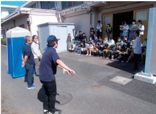
コミュニティ・スクール委員や市の防災危機管理課と連携した防災に関する授業

昭和43年 小平市立小平第十二小学校開校 44年 校章制定 プール完成 46年 小平市教育研究推進校 48年 校歌制定 49年 体育館完成 54年 開校10周年記念式典 63年 開校20周年記念式典 小平市教育研究奨励校 平成2年 ランチルーム整備 小平市教育研究奨励校 6年 小平市教育研究奨励校 10年 開校30周年記念式典 11年 コンピュータルーム完成 14年 東京都少人数学習集団による指導法研究推進校 15年 けやき学級開設 18年 小平市教育委員会研究推進校 19年 小平市教育委員会研究協力校 21年 開校40周年記念式典 23年 小平市教育委員会研究奨励個人・グループ研究校 24年 東京都スポーツ教育推進校・体育講師配置校 東京都教育委員会「子供の体力向上推進優秀校」受賞 25年 東京都教育委員会スポーツ教育推進校・体育講師配置校 東京都コーディネーショントレーニング実践研究校 東京都教育委員会オリンピック教育推進校 28年 東京都教育委員会道徳教育推進拠点校 29年 東京都教育委員会伝統・文化教育推進校 30年 開校50周年記念式典 31年 東京都教育委員会オリンピック・パラリンピック教育推進校 小平市特色ある教育活動推進校 東京都「法」に関する教育推進校 令和2年 東京都「法」に関する教育推進校 西校舎完成 東京都型学校運営協議会設置 3年 コミュニティ・スクールに移行 東京都小学校体育研究会研究協力校 4年 小平市教育委員会研究推進校（2年次） 国立教育政策研究所教育課程実践検証協力校 5年 プール改修工事完了 6年 屋内運動場冷暖房設備設置工事完了