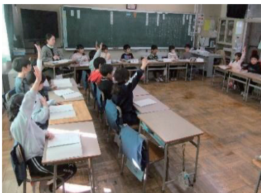
学級会の様子 (学級活動)