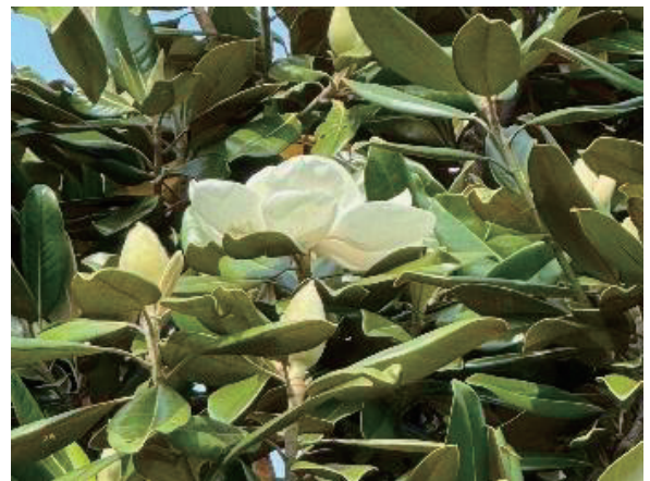
開校記念樹 「たいさんぼく」