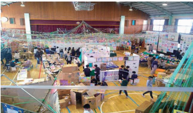
令和6年度展覧会の様子