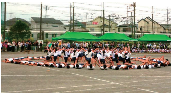
運動会 6年生組体操