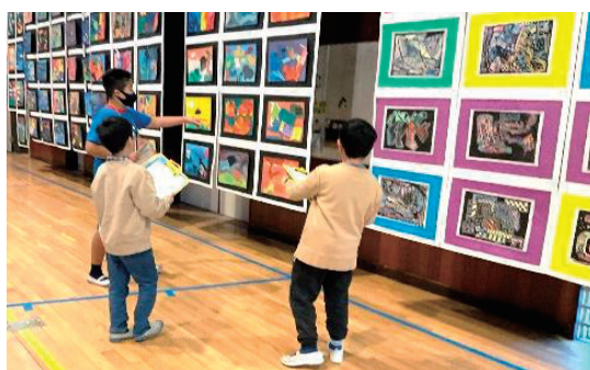
令和6年度 展覧会 なかよし班での鑑賞