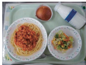
読書月間に合わせた給食(物語に出てくるレシピを再現したメニュー)