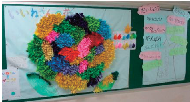
自他の尊重「いいねさんの花」 思いやり「ふわふわ言葉の木」