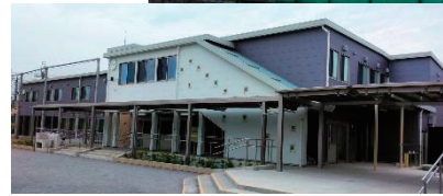
校庭にできた増築校舎「専科棟」