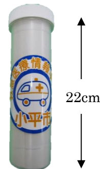
<救急医療情報キット>