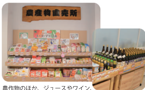
農作物のほか、ジュースやワイン、ジャム、ドレッシングなど加工品も充実しています。またコダイラブランドや洋菓子組合の商品を取り扱っています。