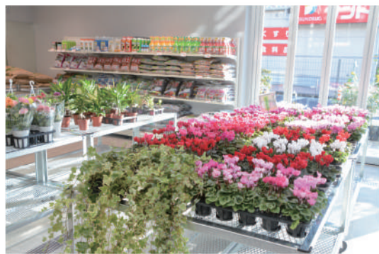
野菜や果物のほかに小平産の花や観葉植物、園芸に役立つ用品も手に入れることができます。