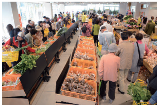
小平市内の農家から新鮮な野菜や果物が集まります。